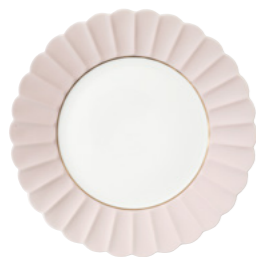
390 015 SA828CR Speiseteller groß Dinner plate 28,5 cm € 263

Matching the service Melon No. 15 by Josef Hoffmann, the plates and our new dessert stand now come in a soft pink reminiscent of spring blossoms. Combined with bold colours and décors, the plates unfold their fresh, sweet and luxurious side.