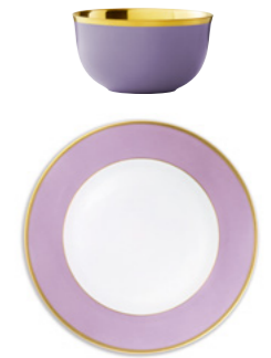
L pale lilac