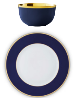
K cobalt blue