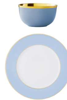
H light blue