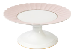
661 015 SA828CR Tortenplatte auf Fuß Dessert stand 28 cm € 585