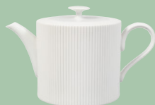
460 R31 B1000 Teekanne Plissée Tea pot biscuit pleated 1,3l € 689