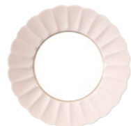
440 015 SA828CR Dessertteller Dessert plate 20 cm € 167