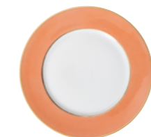
400 001 6825PF Platzteller Peach Charger plate 32 cm € 263