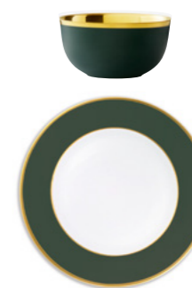
WM forest green mat