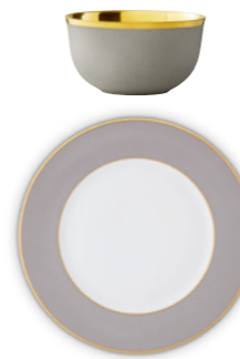
RM smoke grey mat