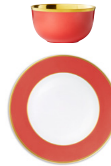
YR carmine red